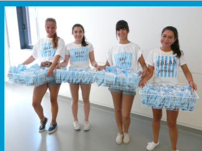
Bolas da Praia para todos!

No sentido de assinalar esta efeméride, o Hospital Vila Franca de Xira sensibilizará os seus utentes e a comunidade para a importância do tema, no dia 10 de outubro.