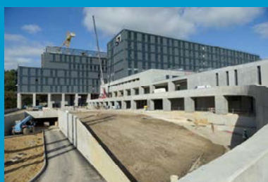
Fotografia de Novembro de 2012