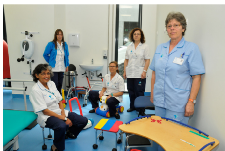
Equipa Medicina Física e Reabilitação