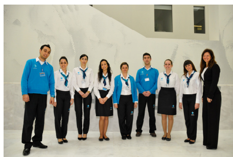
Equipa Administrativa que esteve no arranque da actividade no novo Hospital