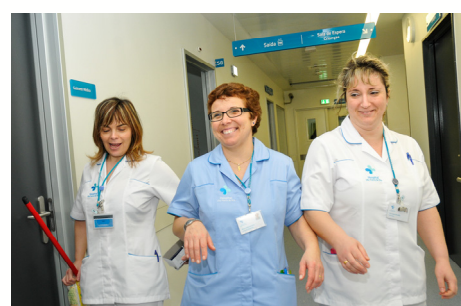
Consulta externa, mulher e criança