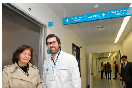
Primeiras consultas de oftalmologia