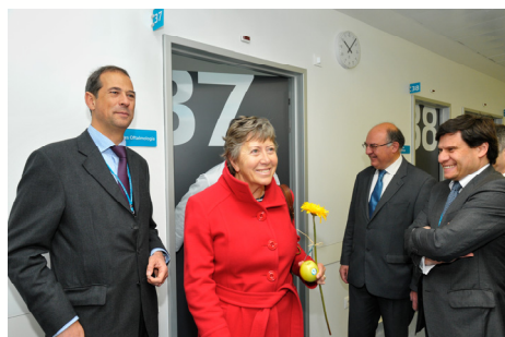
Presidente da CMVFX acompanhou o 1º dia