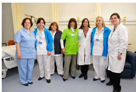
Equipa Hospital de Dia