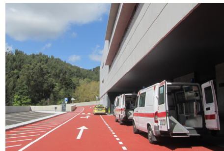
... e a chegada ao novo Hospital