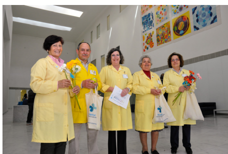
Voluntários do Hospital VFX receberam os 1ºs doentes