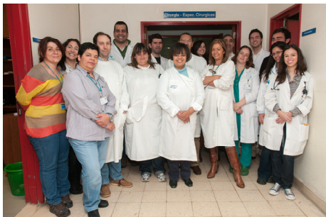
Despedida do antigo Hospital!