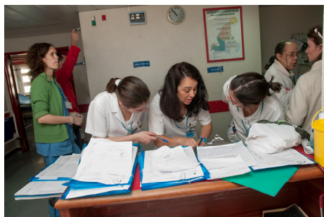
A transferência dos doentes ainda no antigo hospital...