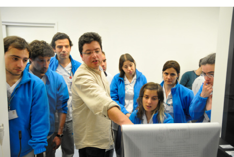
Equipa de Imagiologia