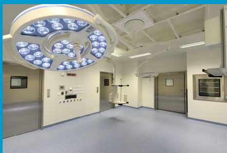
Bloco Operatório, Fotografia de 24 Janeiro 2013